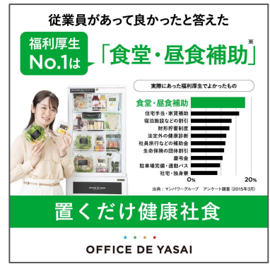
OFFICE DE YASAI