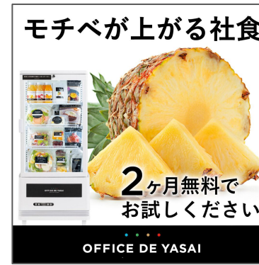
OFFICE DE YASAI